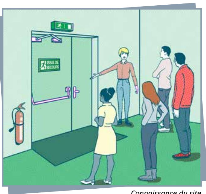
Connaissance du site

Il est conseillé d'organiser un exercice annuel intrusion/attentat en s'inspirant des consignes ou instructions du ministère de l'éducation nationale. A cet effet, un fascicule, destiné en priorité aux mineurs les plus jeunes est joint en annexe au présent guide.